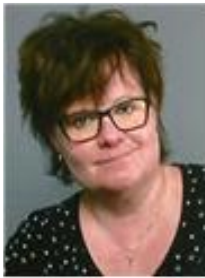
Door Elise Ros