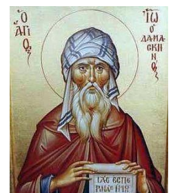
Sint Johannes Damascenus

De heilige Theresia van Lisieux verwoordde het aldus: "Besef je dat Jezus daar in het Tabernakel is, speciaal voor jou, voor jou alleen? Hij brandt van verlangen om in je hart te komen". Zoals Jezus tegen zijn leerlingen zei: "Wie mijn vlees eet en mijn bloed drinkt blijft in Mij en Ik in hem" (Joh. 6, 56). Tijdens de consecratie, spreekt de priester de heilige instellingswoorden uit over het brood en de wijn. Het geconsacreerde brood en wijn zijn nu werkelijk het Lichaam en Bloed van Christus geworden. Sint Johannes Damascenus schreef: "Het brood en de wijn zijn niet een voorafbeelding van het Lichaam en Bloed van Christus – volstrekt niet! – maar het vergoddelijkt Lichaam van de Heer. Want de Heer heeft zelf gezegd: 'Dit is mijn Lichaam'; niet dit is de voorafbeelding van mijn Lichaam, maar Mijn Lichaam . En niet, dit is een voorafbeelding van mijn Bloed, maar Mijn Bloed ".