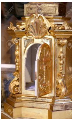
Het lege Tabernakel met geopende deur...

Zoals Jezus van Zijn klederen werd beroofd, zo wordt als het ware het altaar van alles 'berooft'. Er ligt slechts een enkele dwaal (witte linnen doek) op het altaar. De kaarsen branden niet en de Godslamp is niet ontstoken. De deur van het Tabernakel staat open en toont de 'Afwezigheid' van Jezus die nog niet verrezen is. De geopende deur van het Tabernakel en de gedoofde Godslamp nodigen ons uit om stil te staan bij de Waarachtige Tegenwoordigheid van Jezus in het Tabernakel. Tijdens het vieren van de Paaswake neemt Jezus Zijn Plaats daar weer in.