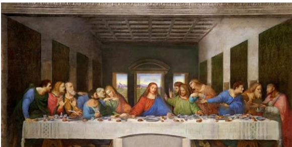
Het laatste avondmaal, geschilderd door Leonardo da Vinci

'waardoor Hij hen toen als Priesters van het Nieuwe Verbond aanstelde' (Catechismus K.K. nr 1337). De Heilige Eucharistie is daarom 'oorsprong en hoogtepunt van heel het christelijk leven'. Tot de kern van de Eucharistieviering behoren brood en wijn, die door de woorden van Jezus Christus en de aanroeping van de Heilige Geest, werkelijk Zijn Lichaam en Bloed worden. Trouw aan het gebod van de Heer blijft de Kerk, tot aan zijn wederkomst in heerlijkheid, tot Zijn Gedachtenis doen wat Hij op de avond vóór Zijn lijden gedaan heeft: Doet dit, om Mij te gedenken!