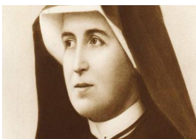
Zuster Faustina Kowalska

Zuster Maria Faustina Kowalska is een Poolse zuster, zieneres en mystica, geboren op 25 augustus 1905 en gestorven op 5 oktober 1938. Het was haar missie om de devotie tot de Goddelijke Barmhartigheid te verspreiden. Op twintig- jarige