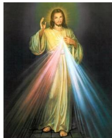
Afbeelding geschilderd door Janice Balabon

Jezus: "Ik wil dat het feest van de Goddelijke Barmhartigheid een redmiddel en een schuilplaats wordt voor alle zielen en in het bijzonder de arme zondaren. Op die dag staan de diepste diepten van mijn tedere barmhartigheid open. Ik stort een hele oceaan van genaden uit over die zielen die tot de fontein van Mijn Barmhartigheid naderen. De ziel die te biechten zal gaan en de heilige communie ontvangt, zal volledige vergeving van zonden en straf ontvangen. Op die dag staan alle sluisen van de hemel, waardoor de genade vloeit, open. Laat geen enkele ziel bang zijn om tot Mij te naderen, zelfs al zijn haar zonden als scharlaken." (Dagboek, nr 699)